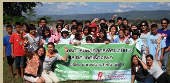
Rencontres entre jeunes atteints du Sida.

Les maisons « Jan and Oscar » et « St Patrick » sont séparées par une cuisine et une salle à manger commune où tous les garçons prennent leurs repas ensemble. Le soir, ils jouent au football, basketball ou au jeu Thai appelé Takraw.